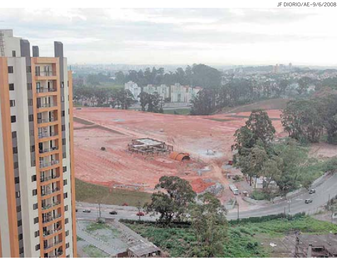
CONSTRUÇÃO – Cemitério embargado foi projetado para ser um dos maiores horizontais particulares

Construção ocorre em área de preservação ambiental de Pirituba; decisão liminar suspendeu atividades