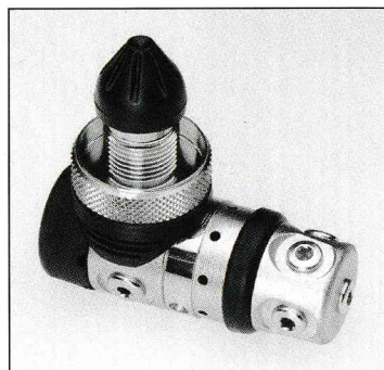
1. Stufe Mk 20 DIN

Wenn das Kopieren eine Form der Anerkennung ist, dann ist der G 250 mit Sicherheit der anerkannteste Lungenautomat aller Zeiten. Doch keiner hat es bisher geschafft eine Kopie zu bauen, die so robust, zuverlässig und leistungsstark ist, wie der SCUBAPRO G 250. Er war die erste 2. Stufe, bei der der Taucher seinen Einatemwiderstand selbst stufenlos einstellen konnte und gleichzeitig über einen V.I.V.A. Effekt verfügte. Über zwei außen angelegte Einstellschrauben kann die Leistung des G 250 individuell an die jeweiligen Tauchsituationen angepasst werden, z.B. bei starker Strömung oder in der Brandung. Beim schwierigen US Navy Test erreichte der G 250 das beste Testergebnis in der A-Rate und war auch bei anderen internationa-